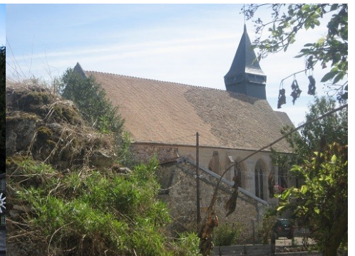
Abords du monument