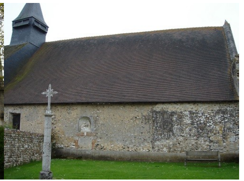
Les restes de l'abbaye